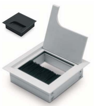
Čtvercová kabelová průchodka